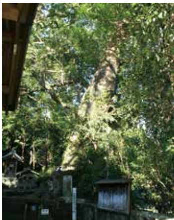
生目神社クスノキ