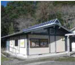
ボランティアガイドの詰所 資料館