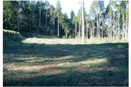
主郭跡地(左側が土塁)