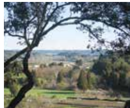
大淀川の花見橋を望む