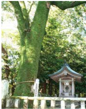
生目神社オガタマノキ