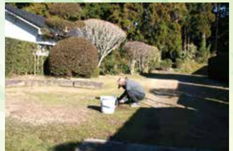
参道沿いの広場の除草