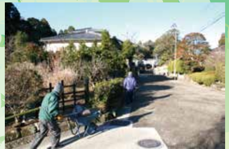
参道清掃に向かう会員