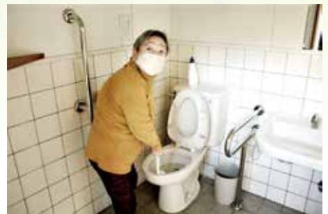
心を込めてトイレ清掃